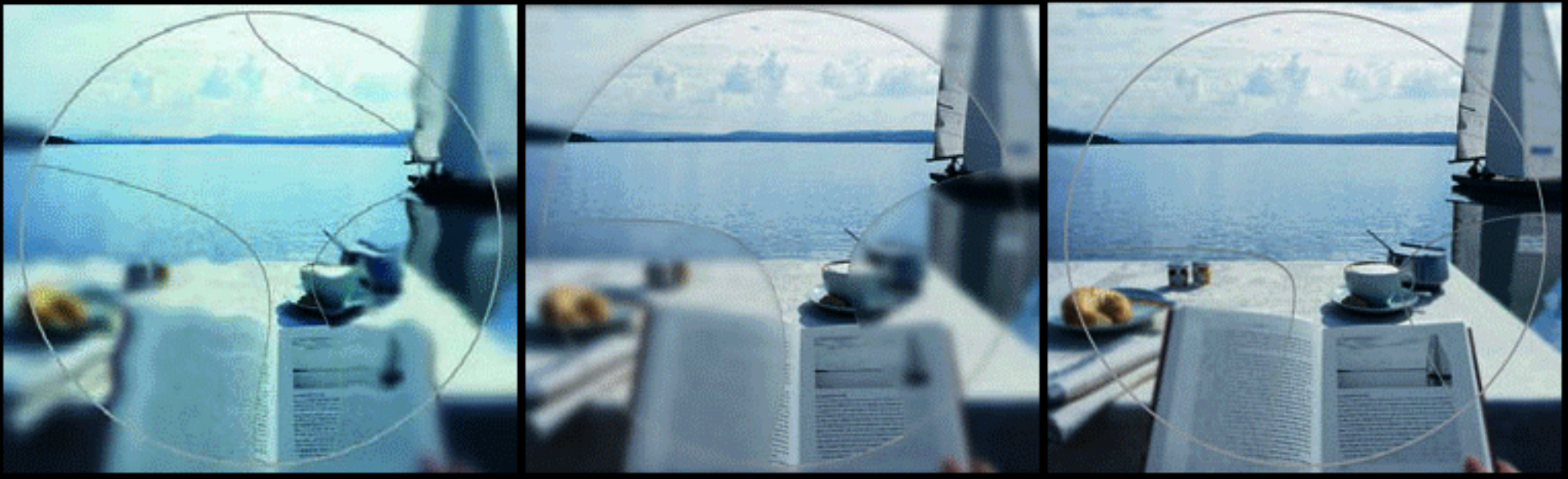
Vlnr: Standaard multifocus lenzen, Premium multifocus lenzen en Hi-End multifocus lenzen

Na dit eureka moment heeft meester Bobi al zijn vrije tijd opgeofferd en studeerde 16 uur per dag om alles over deze lenzen te weten te komen. "Ik had het geluk dat ik al veel klanten had, veel proefkonijnen", zegt hij lachend. "Ik kon me in alle aspecten van het proces verdiepen: het concept, het ontwerp en de technologie. En ik merkte dat dingen die voor de een goed werkten soms voor een ander niet werkten." "Het is een erg gecompliceerde procedure omdat er zoveel variabelen zijn. Om te beginnen zijn er al 300 verschillende type lenzen! De kleinste aanpassingen in de lenzen of het montuur kunnen een wereld van verschil maken. " Naast het uitproberen brengt Bobi ook veel tijd door met overleg met andere experts op dit gebied zoals professoren van fabrikanten van multi focale lenzen uit Japan, Duitsland en andere landen om voortdurend op de hoogte te blijven om er zeker van te kunnen zijn dat hij de ultieme service kan leveren voor een maximale klanttevredenheid. "Hoe meer ik vroeg, hoe minder mensen mij een antwoord konden geven. En langzaam draaide het om, en werd ik degene die hun vragen kon beantwoorden."