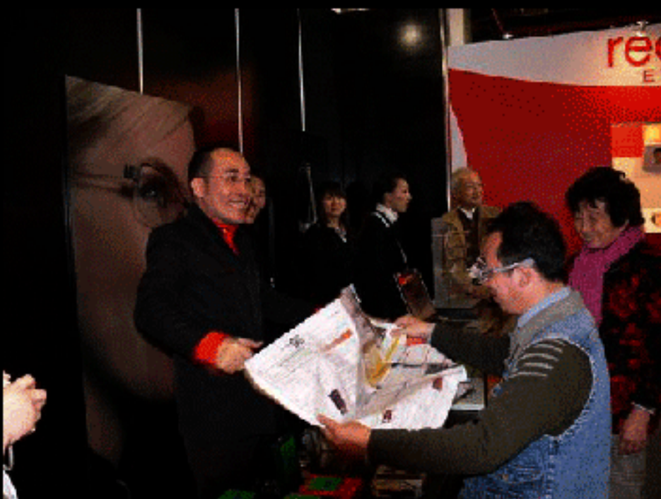
Meester Bobi en 'onmiddellijk kristalhelder beeld op elke afstand zoals toen u jong was' internationale beurs