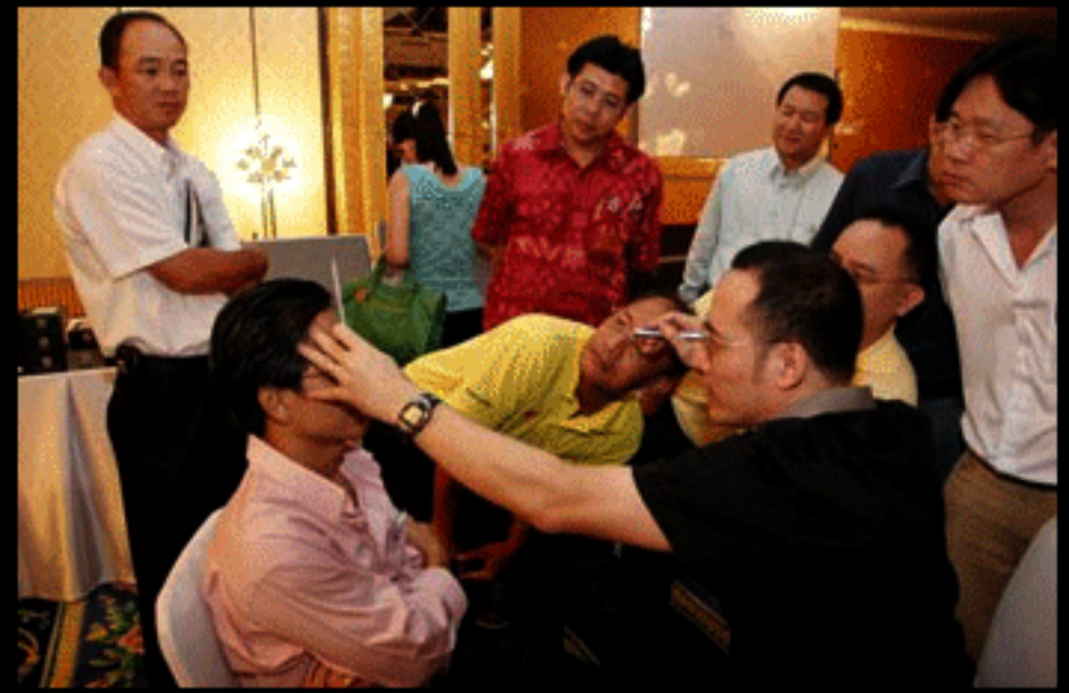
Meester Bobis op een 'Advance Multifocus Lenzen' training in Bangkok

"Het was hard werk om de problemen van de klanten op te lossen en zelfs met doktoren samen te werken om te zorgen dat mensen hun zicht langer konden behouden." Naast het helpen van zijn vader om nieuwe technieken te implementeren om de juiste glazen te vinden hielp hij ook zijn broers en zussen te trainen in het familiebedrijf en een systeem op te zetten dat ze de zekerheid zou geven van de beste marktpositie. "Als ik 'werelds beste ben, zijn zij beslist de tweede.", zegt hij half grappend. Het was slechts 5 jaar geleden, op 37 jarige leeftijd, dat hij besloot dat hij alles gedaan had wat hij kon in de familiezaak. En zo begon een nieuwe fase in zijn leven en begon de wereld kennis te laten maken met de 's werelds beste 'advance progressive' lenzen trainer uit Bangkok.