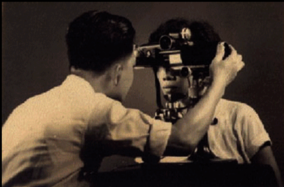
Bobis vader in de goede oude tijd

Nadat hij aan een nieuwe bril geholpen was, vroeg de man wat hij zou moeten doen als Bobi's vader er niet meer zou zijn om hem te helpen. "Mijn vader wees naar mij en zei dat wanneer hij er niet meer zou zijn, 's werelds beste brillen bij mij verkregen konden worden." Zo was de kiem gelegd waar Bobi hard aan heeft gewerkt om tot bloei te laten komen. "Terwijl andere kinderen buiten speelden, vroeg ik mijn vader het hemd van zijn lijf en studeerde op wat hij deed." Vanaf dat moment was hij, afgezien van een korte periode voor zijn studie, altijd in de buurt van zijn vader om alles te leren wat hij kon.