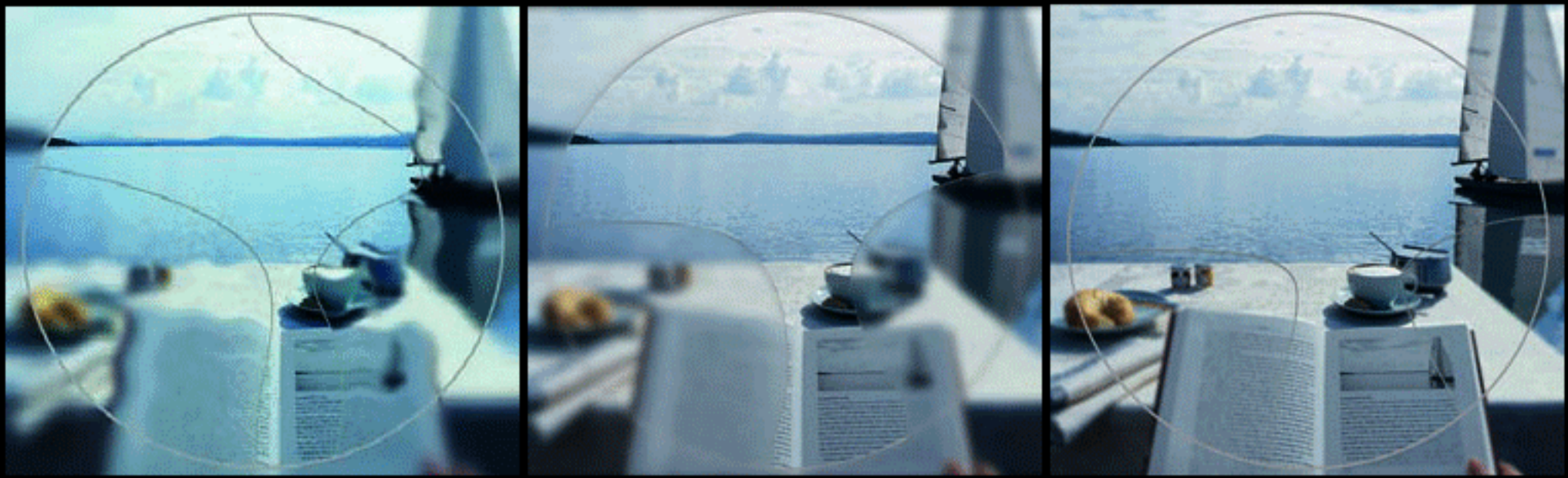
De g. à dr.: Lentilles multifocales normales, lentilles multifocales Premium et lentilles multifocales Hi-end.